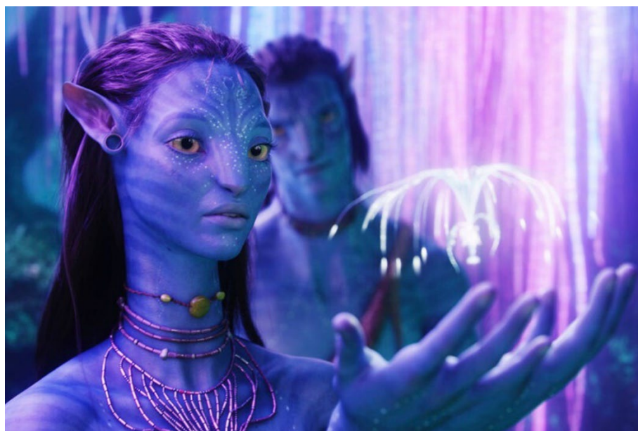
Рис.6. Кадр из фильма «Аватар» (2009 г.) реж. Джеймс Кэмерон

Фильм «Аватар» режиссера Джеймс Кэмерона представляет собой визуальный и научно-фантастический шедевр, который переносит зрителя в мир Пандоры, мир, населенный обитателями, известными как на'ви. Однако помимо потрясающих визуальных эффектов фильм также предлагает интересную онтологическую перспективу на киноискусство.