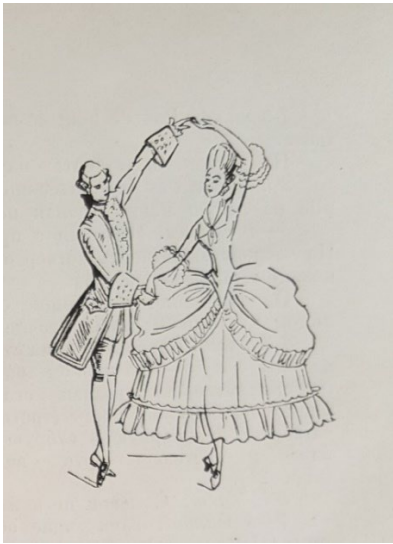
Fig. 11. The cover of the first edition