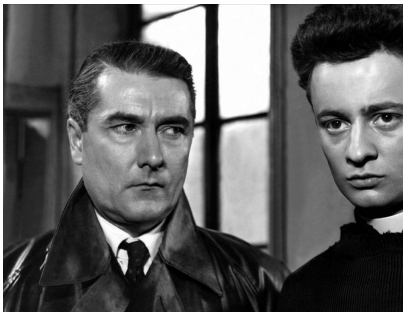
Рис.2. Кадр из фильма «Дневник сельского священника» реж. Робер Брессон (1951 г.)

В фильме рассказывается история молодого священника, который сталкивается с трудностями и духовными испытаниями в маленьком французском городке. Р.Брессон использует плавный монтаж и отсутствие резких смен кадров, планы и статичные кадры, чтобы передать ощущение монотонности и замкнутости жизни главного героя, молодого священника. Например, сцена, где герой идет по деревне или совершает ежедневные ритуалы, длится дольше, чем в традиционном кинематографе, что позволяет зрителю глубже погрузиться через экран в этот мир. Фиксация камеры на одном месте и отсутствие динамичных смен ракурсов создают ощущение замкнутого пространства, в котором развивается действие фильма. Глубина резкости в «Дневнике сельского священника» также играет важную роль. Она позволяет зрителю увидеть одновременно передний и задний планы сцены, создавая ощущение многослойности и глубины. Это усиливает восприятие духовной и эмоциональной борьбы священника.