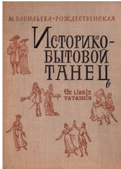
Fig. 12. The cover of the first edition

The research work formed the basis of the famous textbook.