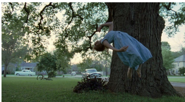
Рис.7. Кадр из фильма «Древо Жизни» (2011 г.) реж. Терренс Малик

Поэтическое повествование, голос за кадром и философские размышления героев изображают события глубоко личного и медитативного восприятия. Весь фильм пронизан глубокими размышлениями главного героя и его родителей о смысле жизни, справедливости, любви и смерти. Эти размышления часто выражаются через монологи внутреннего голоса или голоса за кадром. Например, монолог матери о горе и страдании, или философские размышления отца о вселенной и роли человека в ней. Режиссер использует оригинальные методы, чтобы решать сложные задачи и вызывать глубокие эмоциональные и интеллектуальные отклики при слушании.