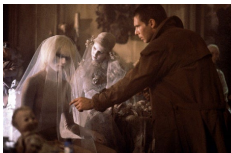
Рис.4. Кадр из фильма «Бегущий по лезвию» (1982 г.) реж. Ридли Скот

восприятием реальности. Городская среда Лос-Анджелеса будущего представлена как мрачная, многослойная и запутанная. Визуальный стиль и атмосфера фильма создают чувство дезориентации и неопределенности, подчеркивая тему того, насколько субъективным и изменчивым может быть восприятие реальности.