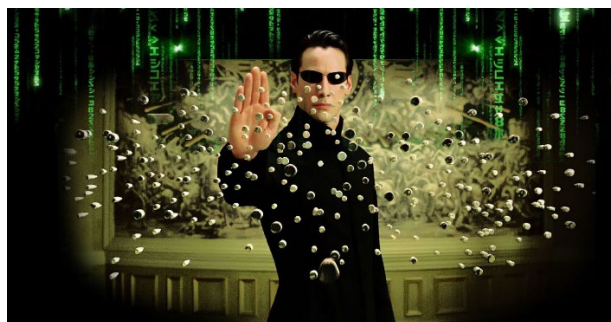
Рис.5. Кадр из фильма «Матрица» (1999 г.) реж. Сестры Вачовски

Фильм «Матрица» исследует концепцию реальности и иллюзии. Он представляет мир, где люди живут в виртуальной реальности, а истинная природа мира скрыта от них.